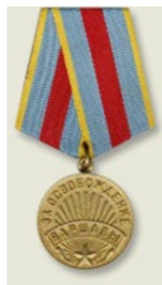
Медаль «За освобождение Варшавы»