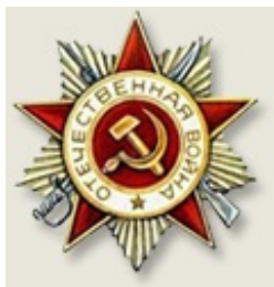
Орден Отечественной войны 2 степени