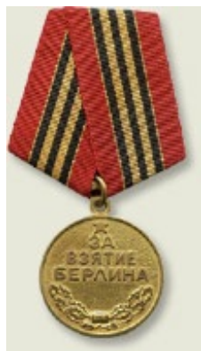
Медаль «За взятие Берлина»