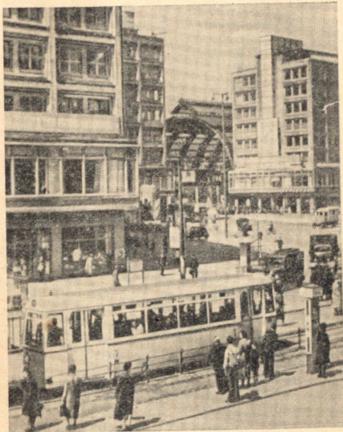
Берлин. Площадь Александерплац

На площади Александерплац ежедневно толпились люди. Они были одеты по-разному, одни в новых костюмах и платьях, другие — в поношенной одежде.