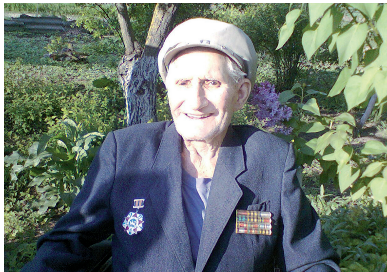
Виктор ГРЕКОВ