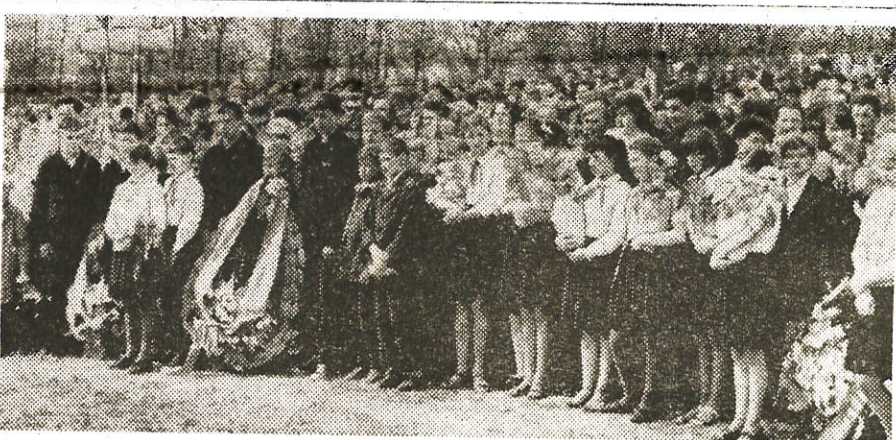
Митинг общественности района на территории бывшего концлагеря «Кошары».

Вскоре заключенных переправили в Каунас, оттуда — в лагерь Восточной Пруссии, а потом на шахты в Судетскую область, где 6 мая 1945 года я вновь встретил свободу.