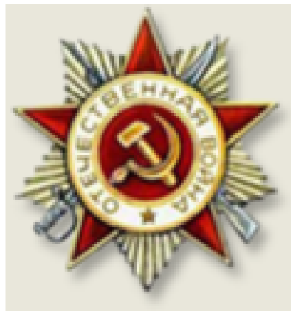
Орден Отечественной войны 2 степени