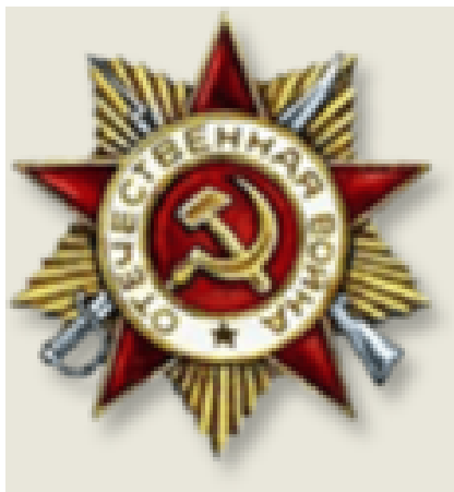
Орден Отечественной войны 1 степени