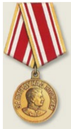
Медаль «За победу над Японией»